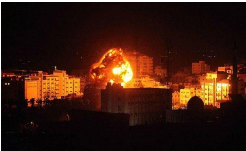
Foto: Fra de seneste dages israelske overgreb mod det besatte Gaza

Uanset hvad så kan det ej hellere forklare HVORDAN denne "super raket fra Gaza" kunne undgå at blive skudt ned i sin lange bane og vej på mindst 110 km af hele de 3 israelske ellers højt besungne "missils-forsvarssystemer" PLUS de amerikanske Patriot systemer og som området omkring det besatte Gaza er spækket med?!!