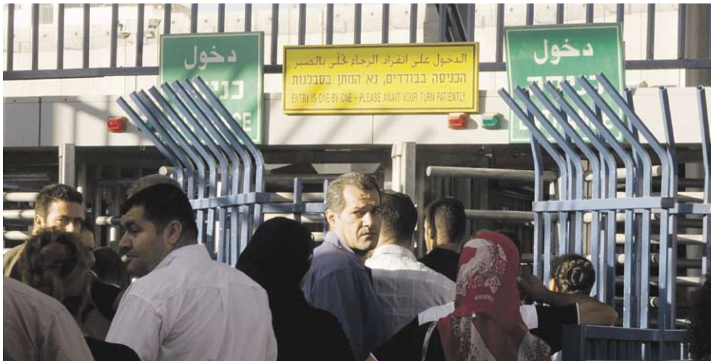
Grænseovergang mellem Israel og Palæstina

Denne artikel og resten af avisen er en del af en oplysningekampagne om Israel-Palæstina konflikten. Artiklerne uddybes i en serie på otte foldere om emnerne: Jord, Vand, Mur, Bosættelser, Flygtninge, Jerusalem, Fanger og EU's associeringsaftale med Israel. Bag alle udgivelserne står Dansk Palæstinensisk Venskabsforening og Palæstina-initiativet.