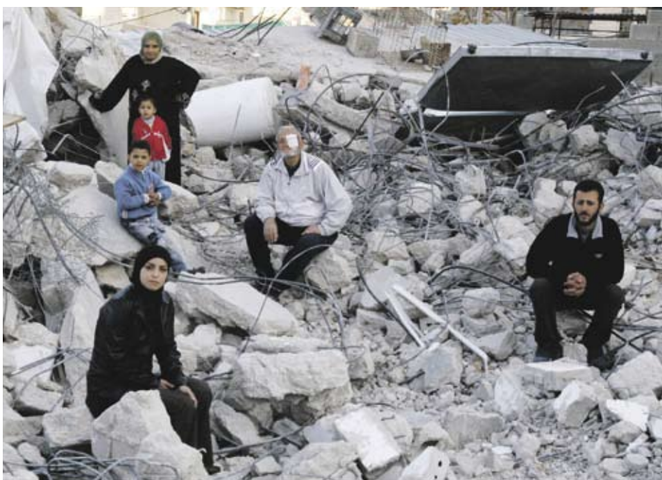
Tusinder er af palæstinensere har fået deres hjem ødelagt af de israelske myndigheder.

Der er forslag om, at arabiske navne på tusindvis af vejskilte og stedbetegnelser i Israel, Jerusalem og muligvis også store dele af Vestbredden skal fjernes og erstattes med hebraiske navne. Betegnelse og navne på steder og samfund, som eksisterede før den israelske stats oprettelse, skal væk. Endvidere forslås det, at det arabiske ord „nakba“ nu forbydes i palæstinensiske skolebøger i Israel. „Nakba“ udtrykker den palæstinensiske katastrofe med zionisternes fordrivelse af over 700.000 palæstinensere ved Israels oprettelse.