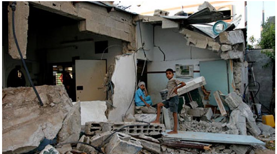
Ødelæggelser i Beit Hanoun