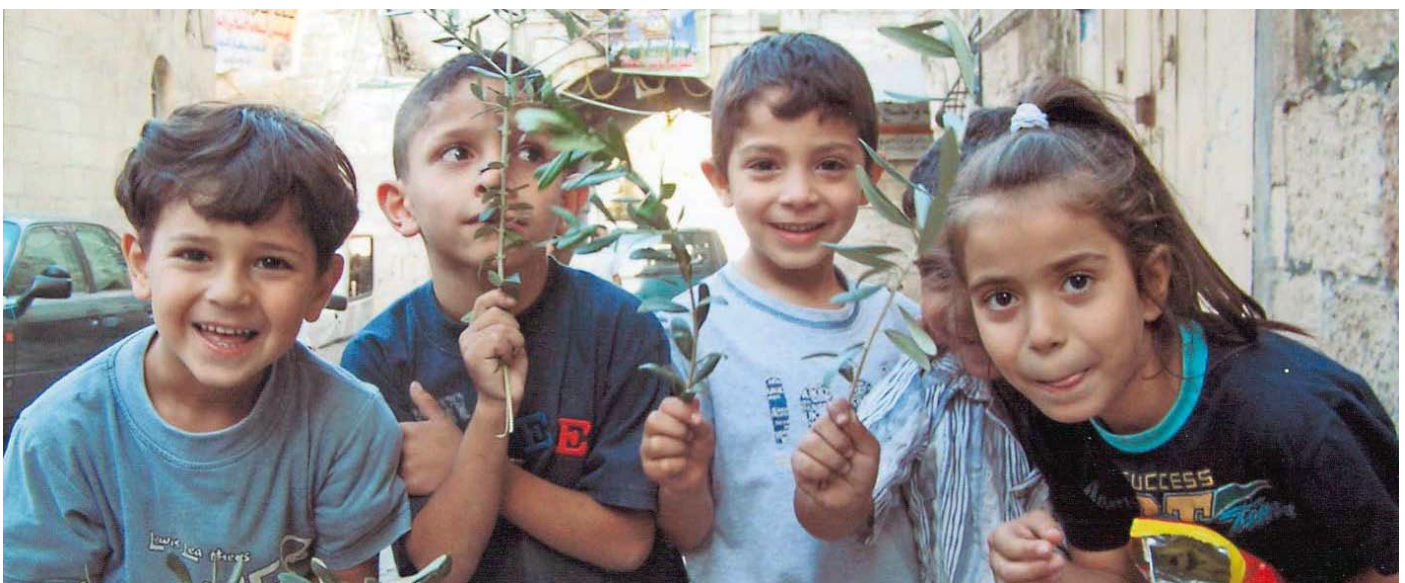
Palæstinensiske børn i Jerusalem